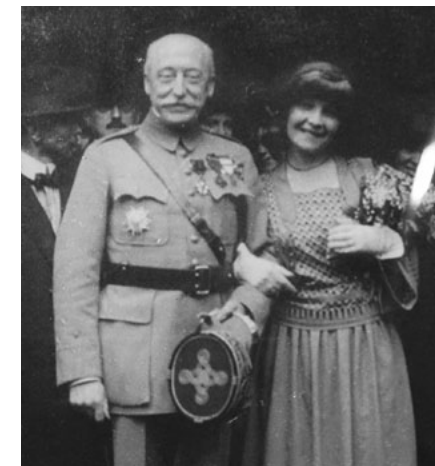
Fotografie s generálem Pellé

Začala se podstatně zajímat o malířství a dávala najevo, že se malbě hodlá věnovat. Rodiče s jejím rozhodnutím zásadně nesouhlasili. Seznámila se s Antonínem Chittussim, který ji přivedl ke krajinomalbě. Definitivní příklon k malířství znamenala její návštěva Paříže, později se tam často vracela, několik let tam i žila. Její budoucí švagr ji seznámil s Mauricem Maeterlingem a Anatolem Francem. Ve Francii studovala na umělecké škole, ale nebyla spokojena s tamním akademickým přístupem. Nebyla vůbec ovlivněna impresionismem, naopak ho odsoudila a považovala ho za příliš formalistický, stejně jako secesi. Seznámila se s Augustem Rodinem, později jej pozvala do Čech, velmi intenzivně si dopisovali.