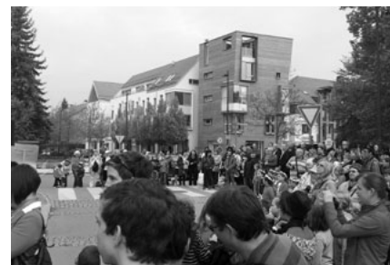
Zájem veřejnosti o školu.