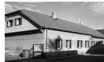
Dům č. 23