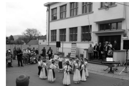
Trocha tance, zpěvu, recitace.