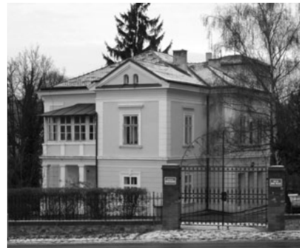
Vila generála Pellé v Krajníkove ulici

Nejmenuje se Zdenka, nýbrž Zdislava Rosalina Augusta. Jméno Zdenka začala používat poté, co do Braunerovy rodiny přišla dcera K. H. Borovského. Braunerova rodina se jí po smrti Karla Havlíčka ujala. Dcera se jmenovala Zdenka a Braunerová ji obdivovala. (Pohotovost k fascinaci obvyklá u hysterických osobností?)