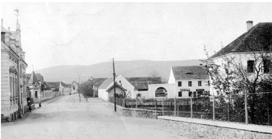
Palackého ulice - Landův statek v místě dnešní Jednoty