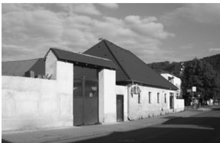
Grunt č. 27 - Kuliškovi

v rodové tradici hospodaření na statku č. 27, ale koupil si bývalý statek č. 41. Otevřel v něm hostinec „U Konrádů“ a provozoval pohostinství. Na parcele bývalého statku č. 41 stály 4 domy: č. 41 obchod a vinárna Josefa Kozáka, švagra Josefa Konráda, č. 42 hostinec U Konrádů a obytné domy č. 43 a 121. (V současnosti první dva domy v ulici 5. května neexistují, byly zbourány. Mladší pamětníci si vzpomenu, že posledním obchodem v domě č. 41 na křižovatce ulic Palackého a 5. května byla cukrárna.)