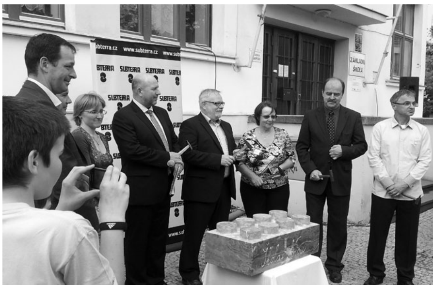
Poslední chvíle před slavnostním poklepem na základní kámen.