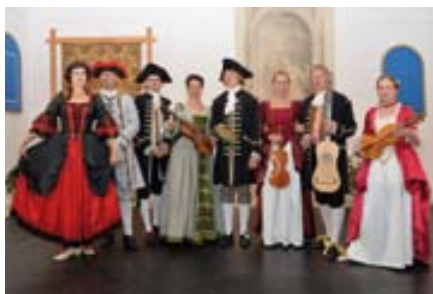
Z Barokních slavností