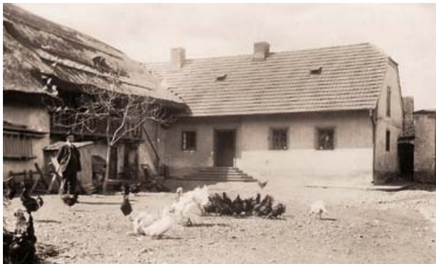
F. Fürst na dvoře č. 45

podsklepeným dřevníkem. Do kravína vedou dvoje dveře vyrobené z fošen, stáj sama je na tehdejší poměry dosti prostorná, ale s nízkým stropem. Z chléva směrem k domu je tzv. řezárna, sloužící nyní za teletník. Krávy, většinou červené straky, jsou z našeho chovu – bývá tam 12 – 15 kusů hovězího dobytka. Chlív je teplý, ale tmavý. Dlouhý kamenný žlab je na straně k zahrádce, voda do něho se zatím nosí a to z kádě umístěné v řezárně – čerpá se v síni, kde přehozením kohoutu se voda pouští buď do chléva, nebo se používá v kuchyni. Studna je však až u Zítkova stavení mezi zahrádkou s několika keři krásných šeříků a chlívky. Na pavlač vedou ze strany obytného stavení dřevěné schody se zábradlím. Pavlač dává statku starobylý ráz, je naší pýchou a neradi bychom se s ní loučili. Je nyní oživena četnými bílými holuby sem tam poletujícími a vrkajícími. Z pavlače vedou troje schody do tzv. komor. Přední je moučná, s truhlami mouky, otrub apod. Prostřední je doménou tatínkových holubů a zadní často doménou němkyň, které dává-