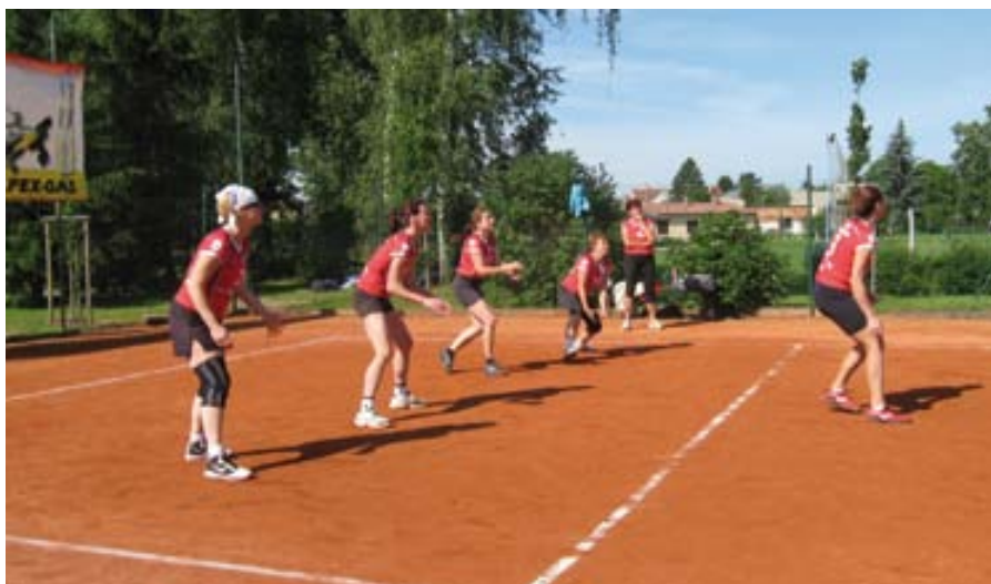
Dobřichovické „seniorky“ v akci