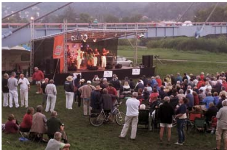
Z dixielandového odpoledne u řeky.