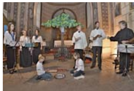
Z Popelky nazaretské