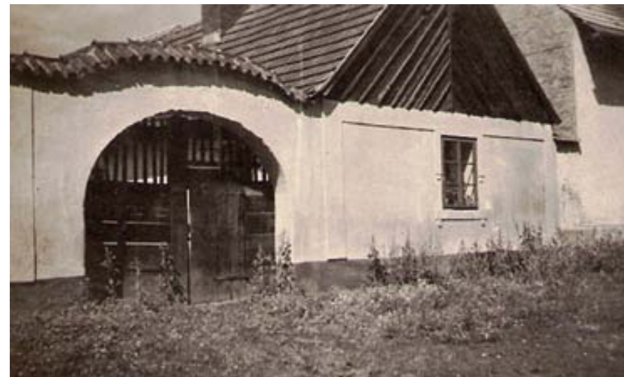
Výměnek č. 45 ke kostelu

jí mně a mým loveckým psům jezevčíkům příležitost k pořádání lovů bez nezvaných hostů. Na různých místech statku jsme též nachytili asi 6 tchořů. Podlaha a strop komor jsou jen z prken. Na půdu se chodí po dřevěných, ostře stoupajících schodech, jdoucích od zadních dveří stáje za 3. komoru a konec pavlače. Stodola sama má uprostřed z jílu, plev a kravince udusaný mlat, po obou jeho stranách za oploticemi jsou perně, které jsou dosti hluboké. Sem se dříve svázely snopy obilí, ale když se nyní mlátí hned z pole na dvoře, dává se sem jen sláma, až na žito, které se ukládá nevymláčené do některých částí perny a vymláčené později na mlatě cepy (obyčejně 4 – 6 žen) nebo i moderní mlátičkou se používá jako dlouhá sláma na došky, nebo se prodává do slavníků, nebo na výrobu zahradnických rohoží. Na patře, slátaném z prken, ale i z postranic vozů, ještě snad za hospodaření strýce Vladimíra Balouna, se ukládá obyčejně směska, hrachovina apod. Stodola je průjezdná, zadními vraty vyjedeme u mlýn-