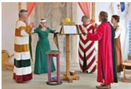
Momentka z úvodního středověkého programu

máci. Zpěvy truvérů, minesangrů, proslulý Letní kánon i třeba tvorba českého arcibiskupa Jana z Jenštejna či Andělíku rozkochný , Ztratil jsem milého nebo Běží malý zajíček zněly svěže, vše ostatně bylo pojato jako setkání a příjemné spolu-pobyty.