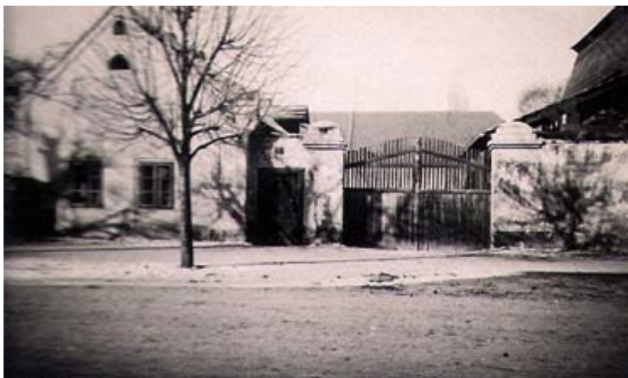
Horákovna, č. 11

ulice nás slunce zdraví posledním paprskem při západu. Před zavedením elektriky stála na stole lampa, která se uplatnila i v době poruchy na elektrickém zařízení ve mlýně / velké voda, poruchy ve vedení, nebo v elektrárně /. Nábytek v pokoji, dlouho vymalovaném vzorem z vinných listů a hroznů nebyl zvláštní. Uprostřed je stůl, zhotovený radotínským dědečkem, truhlářem, v něm to, co může malého kluka přitahovat; malá bambitka, ládovačka s dvěma hlavními a pánvičkami, na něž se dávají kapslíky a spuštěním kohoutku dojde k výstřelu, nebo plechová ladička s otvory označenými na do re mi fa atd. a možností řízení na cis nebo dis – používaná tatínkem při vyučování zpěvu ve škole a řada jiných věcí. U stolu je skrýš a to po stranách šuplete, kde bývají ukládány důležité rodinné listiny. Židle byly od p. Tona běžného typu. Při vstupu do pokoje je postel naší tety, na níž se rozloučila s tímto světem. Původně zde spával Vláďa, teta mívala postel v kuchyni. Po mém sňatku Vláďa přešel na mou postel. Mezi okny je kredenc se třemi šuplaty,