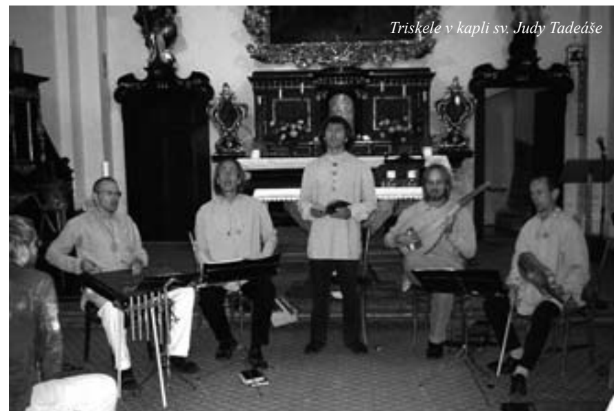
Triskele v kapli sv. Judy Tadeáše