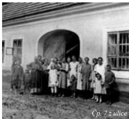
Čp. 7 z ulice

nových. Odtud vedla silnice se švestkovými stromy po obou stranách k mostku přes Karlický potok a odtud poli dále k Letům. Na protější straně cesty byla odbočka potoka, vedoucí do panské zahrady pod silnicí nedaleko popsaného již bílého altánu. Část přebytečné vody ostávala také v louži vytvořené před stavením bývalé vinopalny, aby kachny a husy tohoto okolí měly se kde proplavat. V louži byla voda obyčejně špinavá. Vedlejší větší budova (č. 7 – nyní Dykovi) se stavením nádvořím sloužila dříve za vinopalnu k pálení lihu. Později, když tento průmysl zde přestal, bývaly sem dávány ze dvora ovce a odstavená telata. V přední budově byl kupecký obchod a byt se skladištěm. V obchodě prodávalo se všelijaké zboží smíšené, ale také železářské – kosa srpy, hřebíky, brousky s dřevěnými toulci pro sekáče, zboží střížné, sukno i kůže – vůbec vše, zejména také hojně kořalka. Obchod provozovala rodina židovská pana Fišera, která se později vystěhovala do Ameriky, odkud od ní přišla zpráva, že se jim tam daří dobře. Kořalka vábila k sobě všechny světem se toulající a žebravě osoby, které co vyžebrały, sem donášely a za pálenku vyměňovaly. Fišer krmil tím vepře. Jinak byla rodina Fišerových občanstvem oblíbená a příčinlivá, takže po sobě zanechala nejlepší pověst. Budova dostala od nich pojmenování „Fišerovna“, které se stále udržovalo. Vedle stála ještě menší