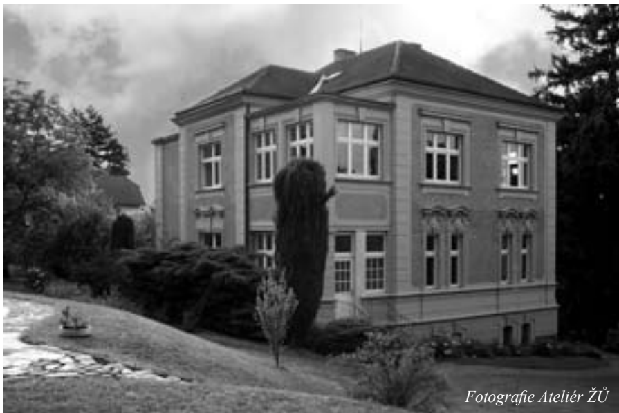
Fotografie Ateliér ŽŮ

V dobřichovické vile čp. 126 v ulici K Tenisu žilo hned několik pozoruhodných osobností a rozhodně stojí za to, abychom jim věnovali pozornost a blíže se s nimi seznámili.