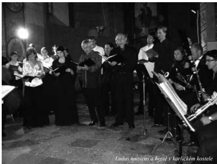
Ludus musicus a hosté v karlickém kostele