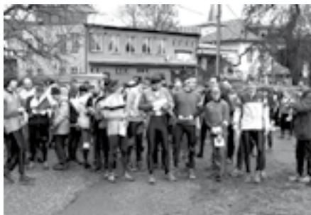
Těsně před hromadným startem jedné ze tří skupin v Kytíně.