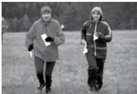
Doběh našich závodnic do Kytína.

Po skončení regulérních závodů podzimní sezony se oddíl OB TJ Sokol Dobřichovice zúčastnil ještě tradičního závodu s migrujícími kontrolami dne 17. 11. 06 na Točné (u Prahy). Potom se již čekalo na sníh, ale ten již do konce roku nepřišel a v protikladu s předchozím rokem se pak po celou zimu mohlo u nás na Hřebenech nejvýše tak tři dny na lyže. Ale i na horách byly podmínky nepříznivé. Tak se i naši závodníci, kteří se v předchozích letech účastnili lyžařských orientačních běhů, letos žádného nezúčastnili. Také naše tradiční lyžařské soustředění v Krušných Horách se příliš nevydařilo, a to hlavně pro nekvalitní sněhové podmínky. Za poněkud lepšími podmínkami se jezdilo do Německa.