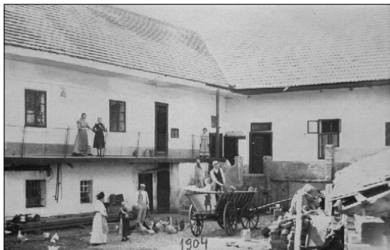
Mlín a dvůr v roce 1904. Dveře a okno v pravé části byly zrušeny při přestavbě západní části objektu mlýna na RD čp. 888 v letech 1990 až 1993, okna a dveře v levé části byly vyměněny při současné přestavbě, ale otvory byly zachovány ve stejných místech.

Mlín a dvůr v roce 1923. Terasa byla při přestavbě v roce 1936 zakryta (zimní zahrada je i v nejnovější podobě objektu), díly zábradlí byly použity k oplocení dvora v ulici Za Mlýnem (slouží dosud).