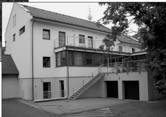
Mlín v roce 2006.

Mlín v podobě, kterou získal v roce 1936 (s přestavěnou západní částí z let 1990 – 1993), fotografie pořízena před aktuální rekonstrukcí.