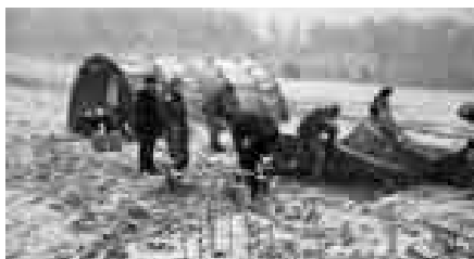
V bahně a sněhu stavěli pořadatelé stany při letošních Pražských Velikonocích ve skalách.