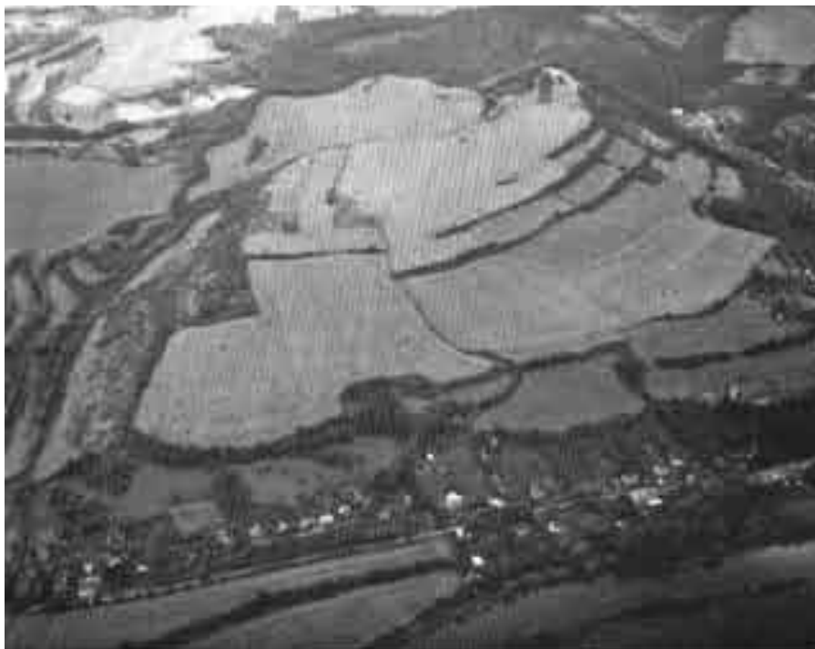
Stradonice, letecký snímek prostoru oppida. Foto M. Špelda. (Převzato z publikace Encyklopedie hradišť v Čechách, s. 295)

popis pochází již z r. 1845, ale hlavní pozornost byla tomuto místu věnována od 2. srpna r. 1877. Tehdy se tu totiž našel mincovní poklad, který lokalitu uvedl ve všeobecnou známost. Byla nakonec srovnávána i legendárním Bibracte. Poklad obsahoval 200 zlatých a stříbrných mincí a ve své době patřil k největším archeologickým objevům Evropy. Publikace zpráv o nálezů vedla ale k jakési zlatokopecké horečce. Obrovské množství lidí se na místo vydalo hledat další poklady, což vedlo k nekontrolovatelnému drancování lokality. Zprávy hovoří o tom, že denně na lokalitě kopalo až 300 lidí, byly zde vytvářeny přísně střežené parcely, kopáči byli ozbrojeni. Zlatých mincí, po kterých kopáči tolik bažili, však bylo nalezeno málo. Proto se začalo obchodovat s jinými nále-