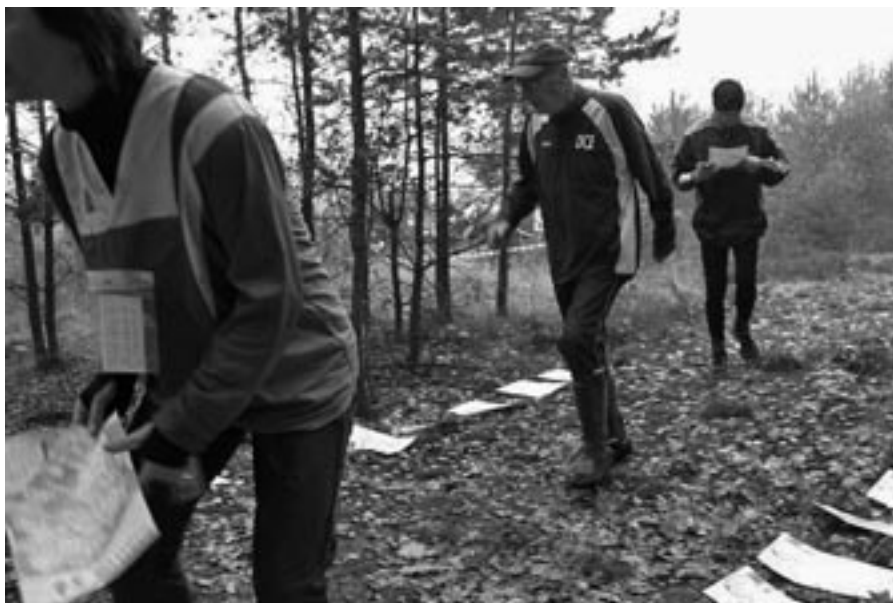
Po startu u výdeje map při závodě u obce Kozly“