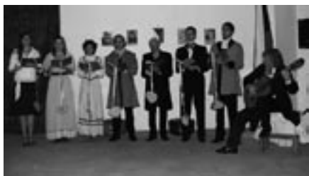
Ludus musicus