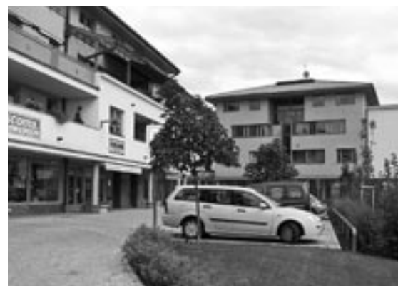
Dokončený dům E a obchodní parter mezi domy D a E.

Na straně 9 minulého Kukátka se v článku o dokončeném domě E (dnes čp. 1084) v ulici V Zahradách za nákupním střediskem Jednoty objevila fotografie, jejíž identifikace byla vpravdě nemožná. Přenosem z elektronické do tiskové verze došlo k poškození fotografického podkladu a nikdo si toho nevšiml. Ještě jednou se omlouváme a zveřejňujeme fotografii znovu.