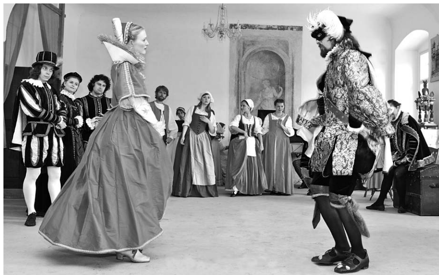
Z představení Gastoldiho Balettù.