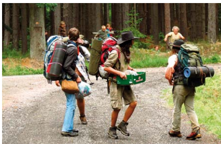
Desperáty jsme nakonec po dlouhé cestě dostihli při předávání kontrabandu a spravedlivě potrestali.