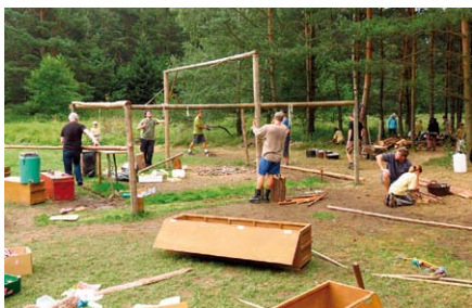
Bohužel celých 14 dní uteklo jako voda v Mississippi a už jsme museli končit. Poklad sterého Henryho se nám podařilo najít a tak už zbylo jen celý tábor zbourat a vše uklidit tak, aby po nás zase zůstala jen zelená louka.