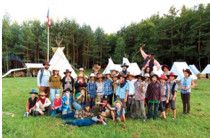
Na závěr jsme se společně vyfotili.