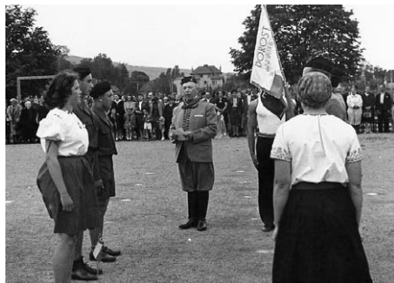
Ze slavnostního předání praporu dobruškovským dorostencům r. 1948.

První poválečný slet připravovaný v době před Únorem a probíhající už za nastupující totality se konal po desetileté přestávce, vynucené okupací a válečným stavem. Byl tehdy jinak organizován, než je tomu dnes. První sletové dny patřil Strahov žactvu, další dorostu a závěrečné dny dospělým. Po nástupu na společná prostrná chlapců a děvčat, začala část cvičenců volat: „Ať žije prezident Beneš!“, což se pomocí rozhlasového přenosu dostalo na veřejnost. Průvod žactva Prahou byl údajně pro špatné počasí odvolán. Ale toto volání se ozývalo i pak v průvodu dorostenců a dorostenek, vždyť bylo jen krátce po Benešově abdikaci. V průvodu se roznesla zpráva, že někteří cvičenci před tribunou, kde stál Klement Gottwald, odvrátili tváře a mlčky prošli a potom opět volali: „Ať žije prezident Beneš!“ nebo podle jiných také: „Byli jsme a budem, za Benešem pudem!“ Průvod mužů a žen byl již kontrolován ozbrojenými složkami SNB a Lidovými milicemi. Asi 60 účastníků bylo vytaženo přímo z průvodu a zatčeno, jiní byli zatýkáni po skončení sletu. Mnozí byli