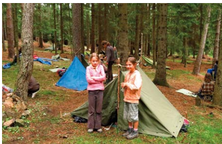
Nocovali jsme na cestě vysoko v kopcích, kde mrahy byly tak nízko, že jsme se jich mohli dotknout.