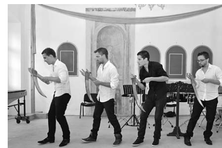
NeoPercussio ve skladbě pro 4 kosy.

Neděle 12. srpna byla posledním festivalovým dnem. V dobřichovické křížovnické residenci se představili opět soubor Ludus musicus a také soubor Školy starého