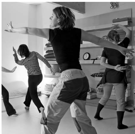
Taneční dílna v CKP Dobřichovice

program tanečního odpoledne. Pro ženy-tanečnice to byla cenná zkušenost, velký taneční a pohybový pokrok a jedinečný zážitek z práce s profesionální zpěvačkou a muzikantkou, která hlas a zpěv využívá také jako léčebnou metodu. Tanečnice daly této společné akci spoustu volného času a statečnosti postavit se na pódiu před své děti, sousedy, příbuzné a další diváky. Spokojenost byla nakonec na všech stranách. Věřím, že se tím podařilo ukázat, že tanec nepatří jen úzké skupině vyvolených, ale že si ho může vyzkoušet a kultivovat i mnohem širší okruh lidí.