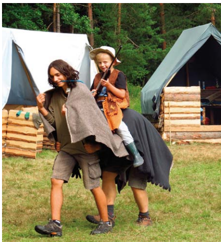
Na oslavu našeho úspěchu jsme uspořádali kovbojské hry, které zahájil nejstatečnější z nás výstřelem ze své medvědobijky.