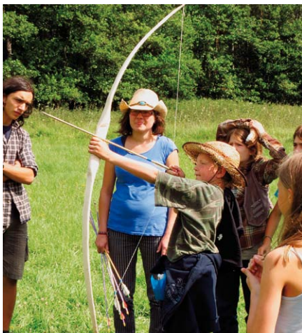
Při soutěžích jsme házeli lasem, stříleli z luku, běželi věhlasný Joe's Run a večer oslavili celý den povedeným potlachem v tee-pee.