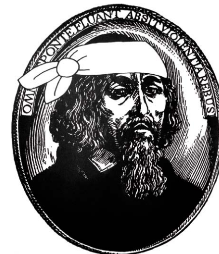
Učitel národů krátce poté, co se dověděl o nové školské reformě.