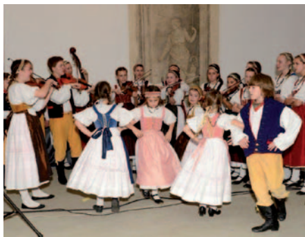
Notičky hrají, zpívají i tančí