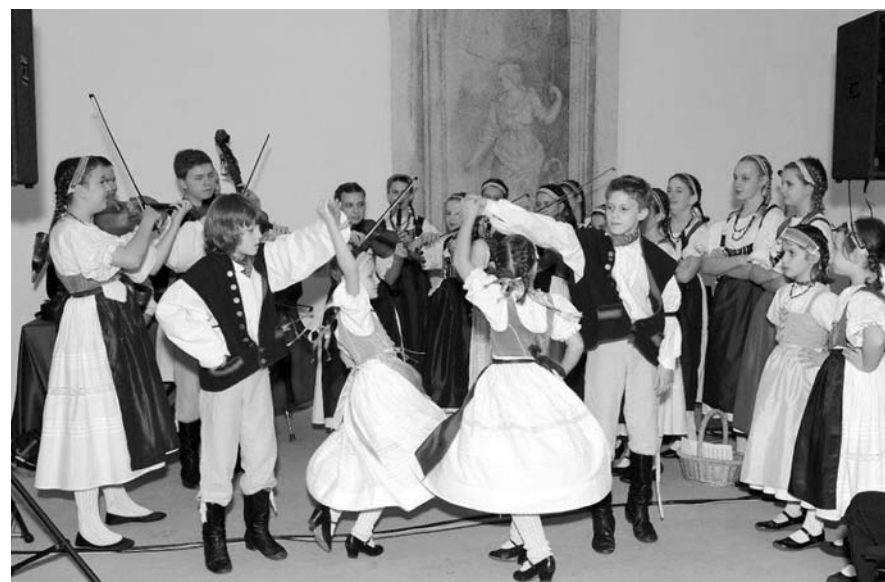
Soubor Notičky v akci.