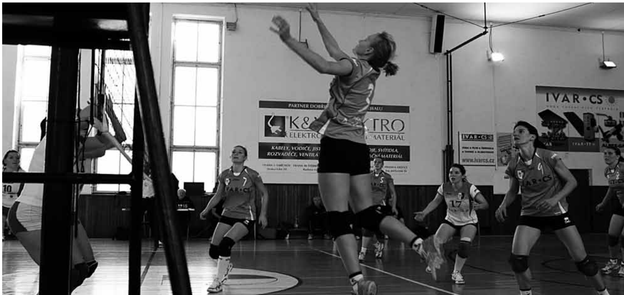
Ženy v akci aneb: jak tohle dopadne?