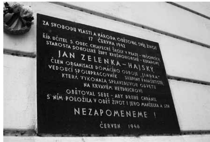
Pamětní deska na škole v Kodaňské ulici