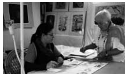
Příprava k fantazijní tvorbě

základní idea těchto privátních kursů, založená na dlouholetých zkušenostech umělkyně - universitní pedagožky - s výtvarnou výchovou dětí, mládeže i dospělých. Je přesvědčena, že každý má v sobě uloženy skryté tvořivé síly a talenty a že stačí jim dát základní technickou průpravu, čas a dobré prostředí, aby se projevíly. Proto učí základním technikám práce s malířským a kresebným materiálem snadnými metodami, které zvládnou i děti. Důkladným prozkoušením vlastností pastelů na men-