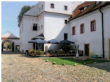
restaurace Zámecký had