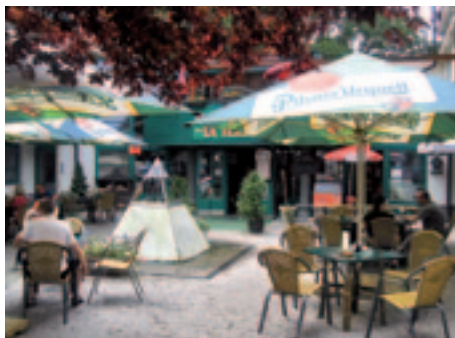
pizzeria La Teresia na Palackého náměstí