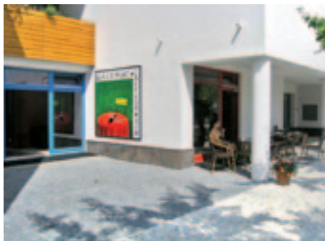
café bar v galerii pana Bíma v ul. 5. května