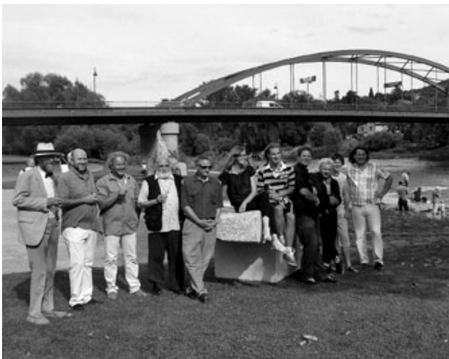
Účastníci 5. ročníku Sochařského symposia. Další fotografie k článku naleznete na stránce 37.