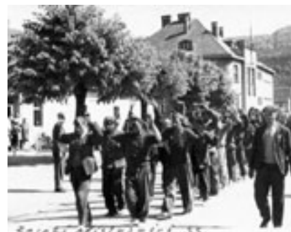
květen 1945: zajatci označování za příslušníky SS