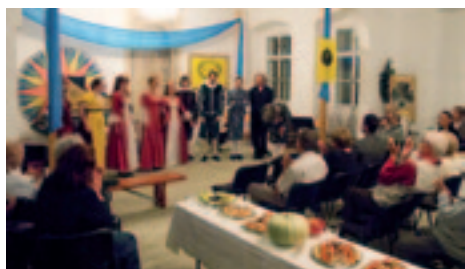
Z provedení Gastoldiho Balletů