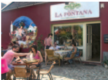
vinotéka La Fontana na rohu ulic 5. května a Vítovy