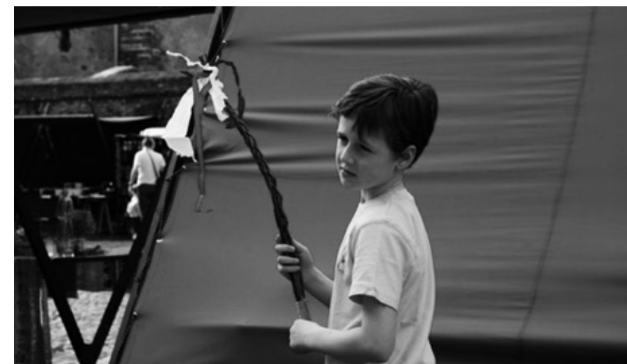
Jarní trhy Dobřichovice 2009