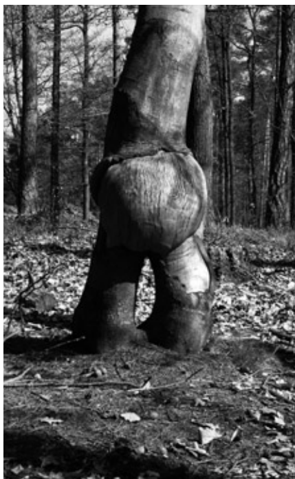
Tajný poštovní úřad brdských skřítků.

Nyní již víte, co máte hledat, tedy samo-