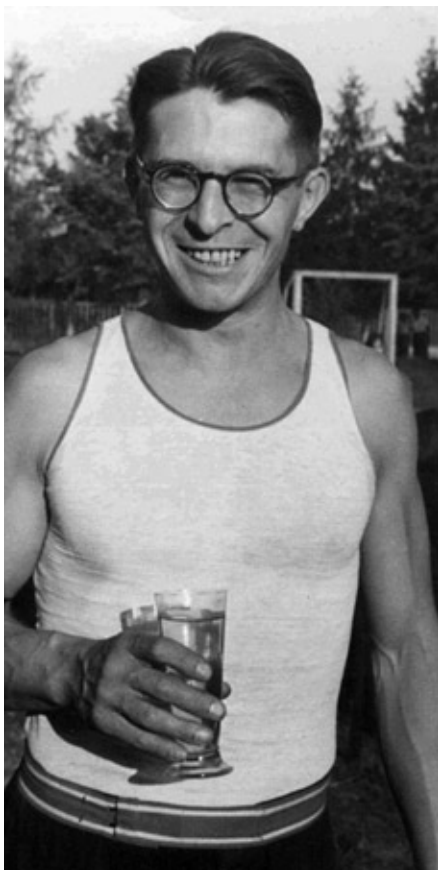
Bratr Mak jako cvičitel

úřady činnost Sokola zastavily a o půl roku později sokolské organizace v Pro- tektorátu rozpustily a zakázaly.