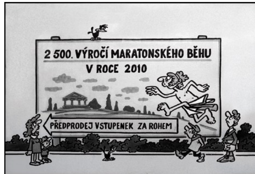
Obrázek, který vznikl v ostravském televizním studiu pro pořad Matematika převážně vážně , na němž doc. E. Calda, HgS, spolupracoval.