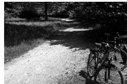
Inn Radweg (517 km dlouhá cyklotrasa podél řeky Inn)

Vzhledem k tomu, že se o této stavbě dosud nikde nepsalo, nikdo o ní nic bližšího nevěděl, o Zkrášlovacím spolku jsme také slyšeli poprvé, tak jsme se začali zajímat. Zjistili jsme, že Zkrášlovací spolek má stejné sídlo (Slapy 67) jako jeden z majitelů společnosti Altstaedter Investments a.s., což je společnost, která vlastní řadu pozemků – některé např. ve Všenorech nedaleko řeky, a která projevuje zájem o výstavbu na těchto dosud nezastavěných pozemcích v záplavovém území.