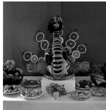
Arcimboldovská ovocná tabule, již vévodil mohutný páv