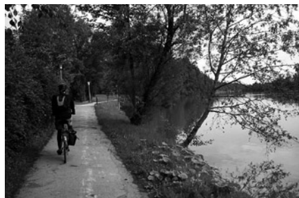
Isar Radweg (290 km. dlouhá cyklotrasa podél řeky Isar)