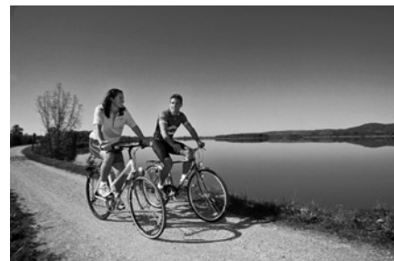
Inn Radweg (517 km dlouhá cyklotrasa podél řeky Inn)