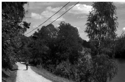
Donau - Regen Radweg