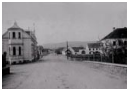
Pohledy od mostu a z křižovatky na starou školu v ul. 5. května kdysi a dnes (k článku na str. 9-10).