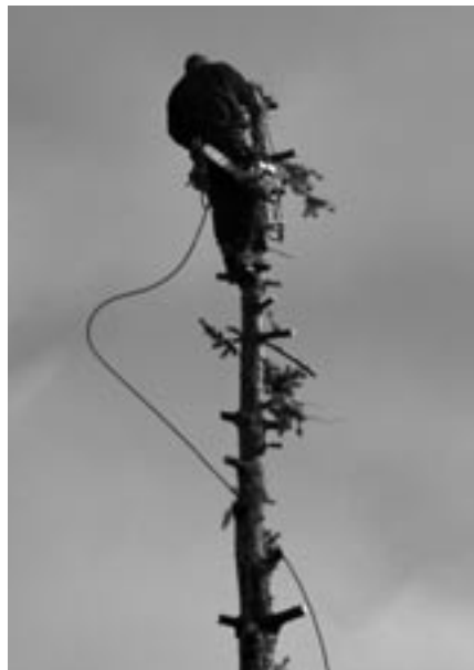
Fotoreportáž Jiřího Geisslera z kácení stromu v jedné dobřichovické zahradě.