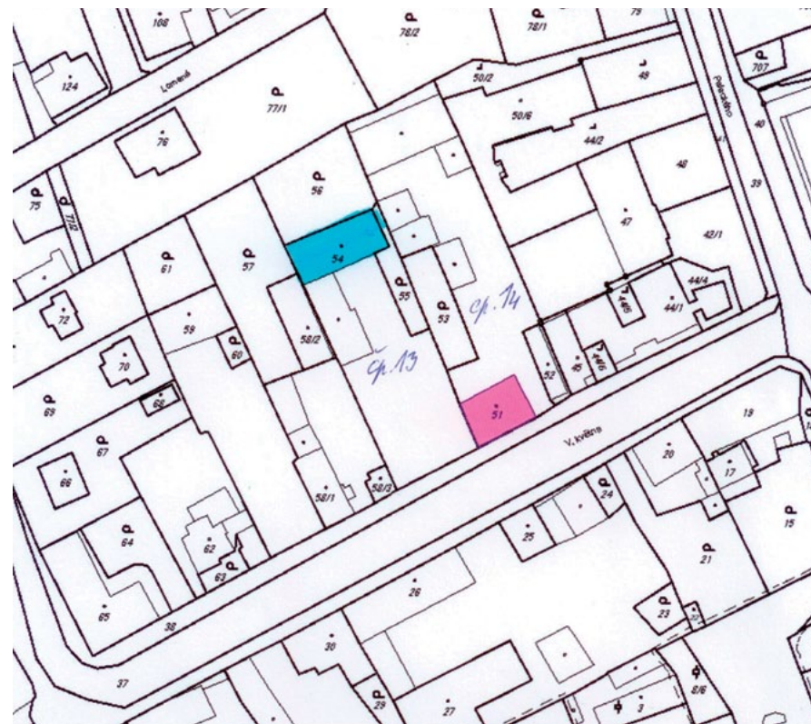
Situační snímek znázorňující umístění domů čp. 13 a 14 v ulici 5. května dnes.

Pozn. V obci Mořina bývala synagoga a židovský hřbitov, ten byl po r. 1990 pietně upraven. Synagoga byla po svém zrušení ve 20. letech minulého století židovskou obcí darována sokolům, kteří ji upravili na sokolovnu. Ani ta však v současnosti neexistuje, protože je objekt v soukromých rukou.