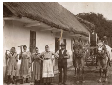
Nejstarší dochovaná podoba statku č. 14