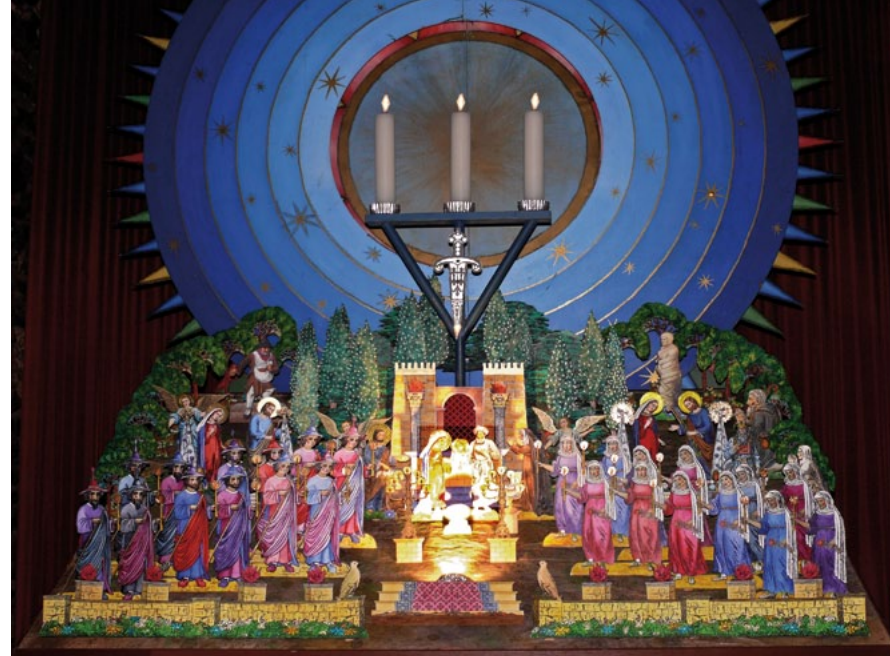
Hromniční betlém.

sklidily veliké uznání na světové výstavě betlémů v Itálii. A po návratu jsme je mohli vidět i u nás.