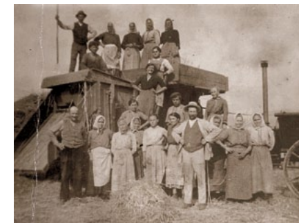
Skupina mlaticů v č. 14