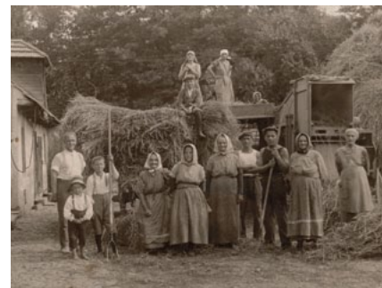
Mláčení obilí ve dvoře č. 14