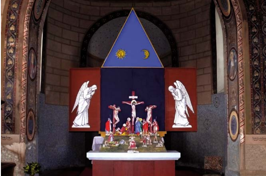
Postní betlém, Karlík 13. 4. 2014.

kdy se koukalo jen do zítřků, a to ponejvíce světlých ... Sice jsme třeba Třebechovický betlém ukazovali po světě a vytahovali se s ním všude možně, ale ten základ a ony široké vrstvy souvislostí se vytratily a s nimi i pozvolna vůle se po nich pít. Třeba v Tyrolsku či v Bavorsku tomu i přes tamní peripetie bylo přece jen jinak ...