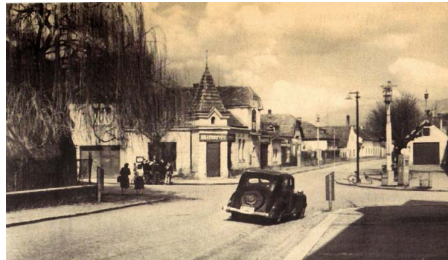
Centrum obce s nárožním domem č. 16