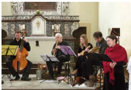
Svobodné bratrstvo v kostele sv. Kateřiny v Chotči

Ludus musicus Popelku provádí pravidelně (měli jsme ji také možnost slyšet na jednom z nedávných koncertů festivalu Musica viva v karlickém kostele). Letošní provedení se uskutečnilo v kouzelné pražské galerii Podkrovi v pražské Husově ulici a bylo velmi