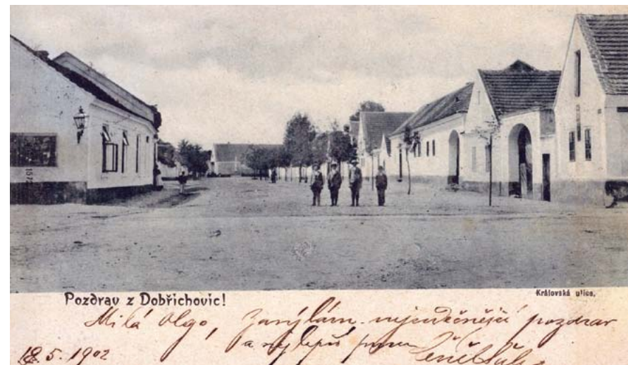
5. května, 1902

Debutovala na karlínské ochotnické scéně. Profesionálně začala hrát v r. 1884 ve