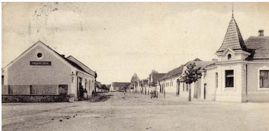
5. května, 1905