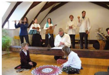
Popelka nazaretská v galerii Podkrovi

Ludus musicus Popelku provádí pravidelně (měli jsme ji také možnost slyšet na jednom z nedávných koncertů festivalu Musica viva v karlickém kostele). Letošní provedení se uskutečnilo v kouzelné pražské galerii Podkrovi v pražské Husově ulici a bylo velmi