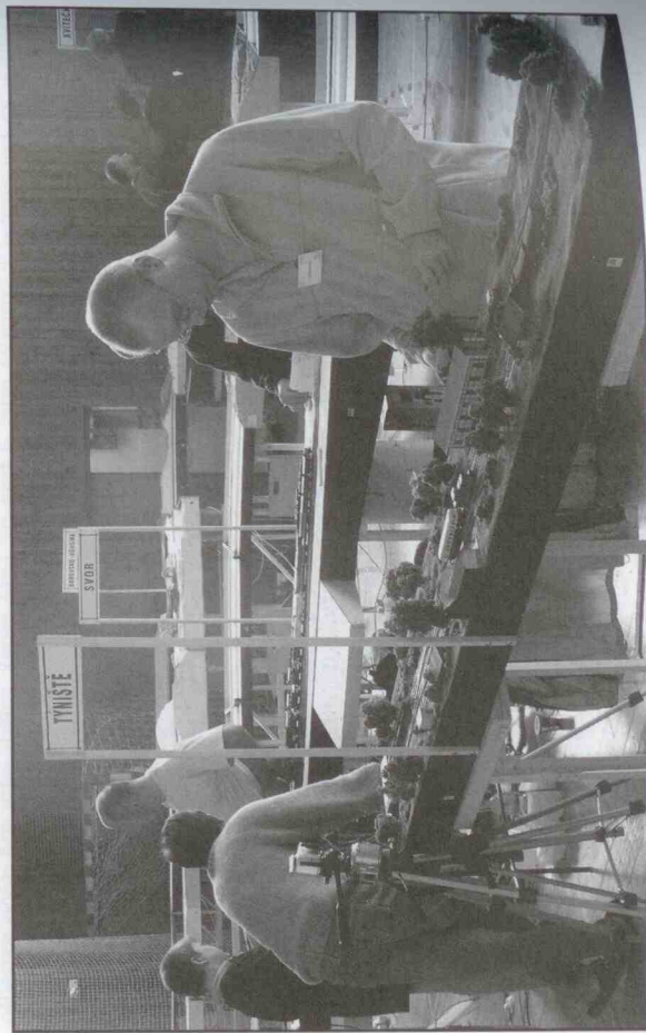
Hračky v hale BIOS