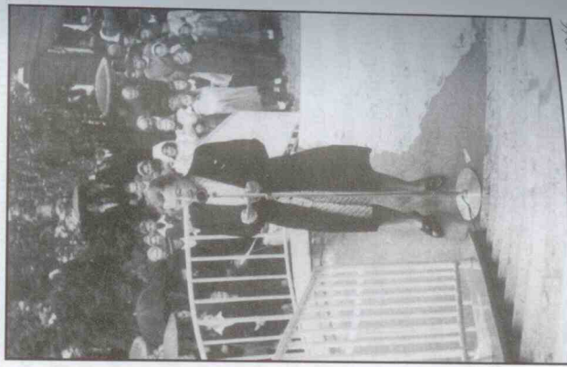
„dr. Milada Horáková v roce 1946 v Dobřichovicích“