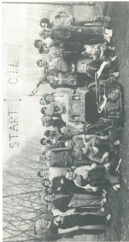
Účastníci štafety po závěrečném defilé.