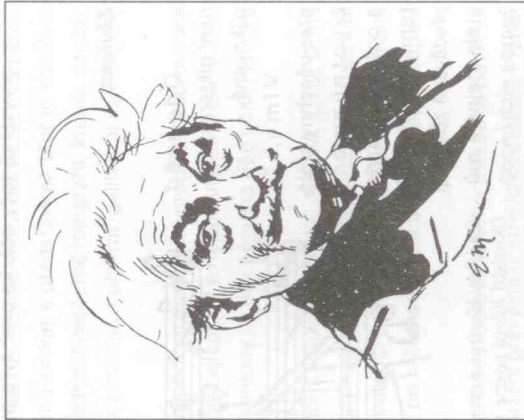
Eduard Milén Leoš Janáček (kresba).