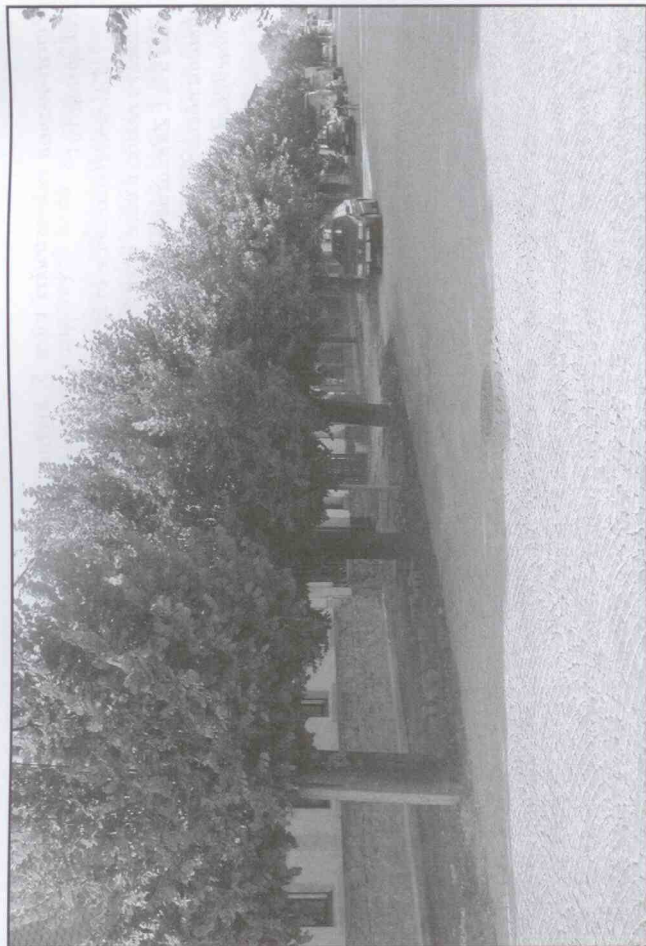
Poslední pohled na původní ulici 5. května