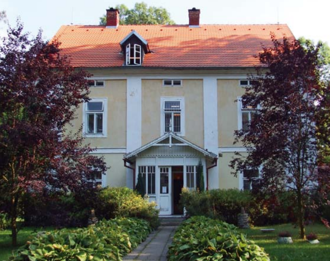
Strž - vila Karla Čapka

jům, které v těchto tragických a bouřlivých letech musel denně podstupovat. Za jeho psacím stolem tu vznikla Bílá nemoc, Matka a Válka s mlouky, díla, v nichž Čapek varuje před fašismem, válkou a fanatismem, díla, která jsou - zejména v souvislosti se současným fanatismem náboženským - aktuální i dnes. A je docela pravděpodobné, že Na Strži, jak své letní sídlo pojmenoval, napsal i následující řádky, které vyšly v Lidových novinách 4. prosince 1938: