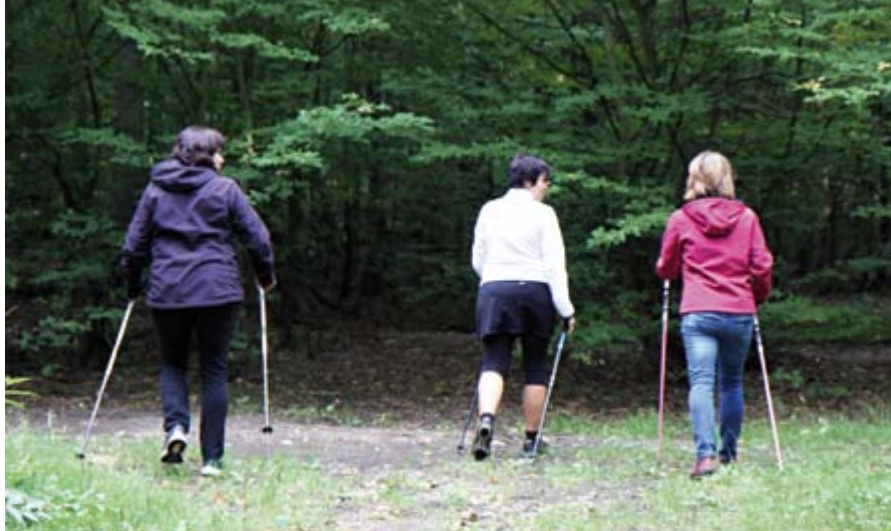
Prevence vzniku poruch pohybového systému - pohyb

může vést k přetížení až bolesti šijových svalů, které nejsou stavěné na nezvyklou zátěž. Zajímavé může být, že i když už je zápěstí zhojené (ověřené RTG snímkem), porušená funkce může stále přetrvávat. To znamená, že není výjimkou, že pacienti po sundání sádry provádí tytéž náhradní pohyby, jaké prováděli, když ještě sádry měli. To vede k cyklení problému, kdy si stěžují na přidání bolesti nejen původně zraněného zápěstí, ale i okolních struktur, např. zmiňované šíje. Funkční poruchy jsou známy tím, že se velmi rády rozšiřují do celého těla. Není tedy výjimkou hledat možné příčiny bolestí hlavy v dolní polovině těla. Nebo sledovat bolestivý ramenní kloub ve spojitosti s chybným použitím bránice a špatným postavením pánve a dolních končetin.