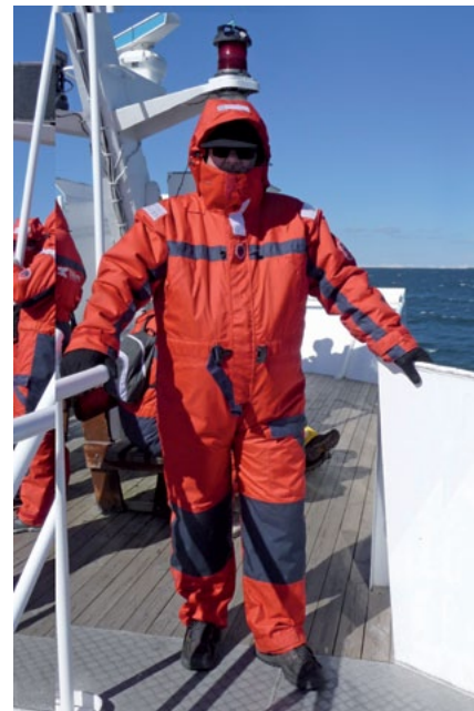
Autor při výpravě za velrybami

Dovedete si představit, jak by to zde vypadalo, kdyby naši předkové postavili Příbram nebo Beroun o kousek vedle, a tím pádem by dnes vedla někde mezi Dobřichovicemi a Karlíkem dálnice? Asi bychom – jako obec – více zbohatli na průmyslových zónách, ale charakter města i celého okolí by byl zcela jiný. A šťastnější by z toho byl asi málokdo.