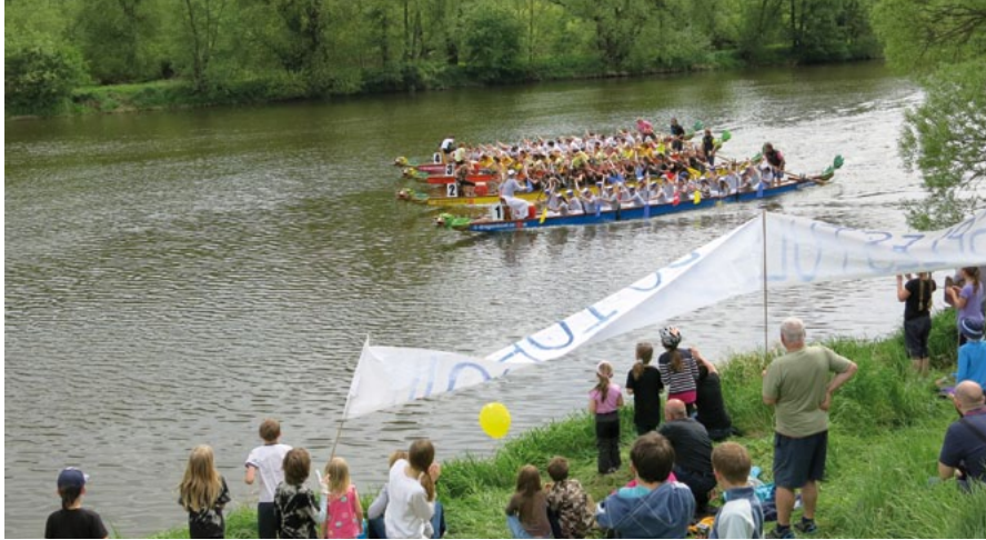
Dračí lodě Dobřichovice 8. května 2015 Celkové pořadí MUŽI, resp. OPEN