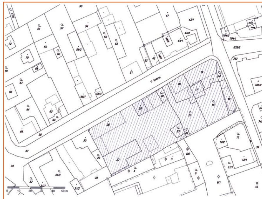
Nynější situace pozemků, na nichž stály nebo stojí budovy popisované v textu