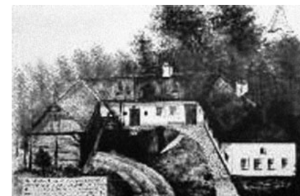
Řezníčkův statek č. 41. obrázek od F. Havlíka z 1. dílu školní kroniky.

(Vybráno ze vzpomínek F. Havlíka ve školní kronice - 1. díl.)