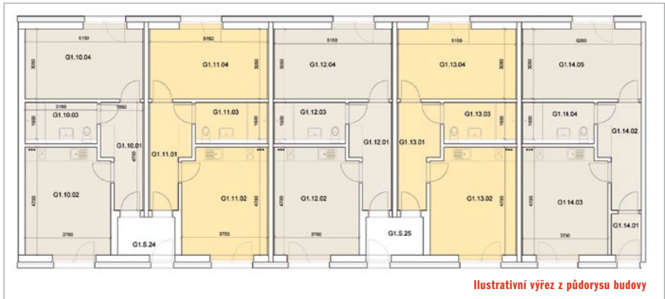
Ilustrativní výřez z půdorysu budovy