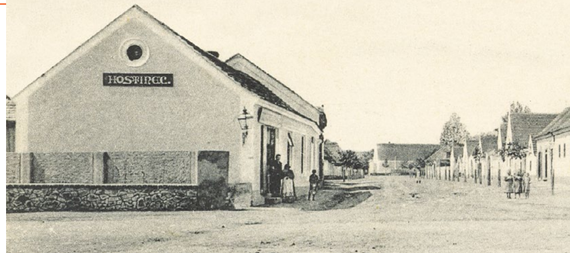
Hostinec U Konrádů (1905)