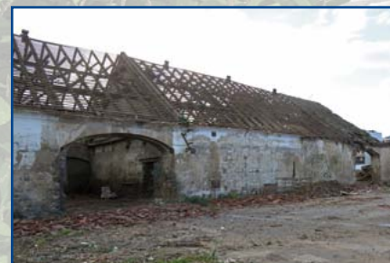
DŘÍVE: západní stodola - začátek demolic