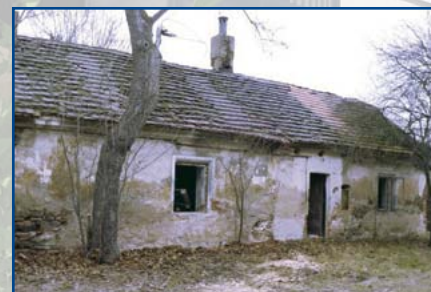
DŘÍVE: mléčnice - západní strana