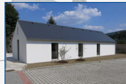
NYNÍ: La Fontana - západní strana