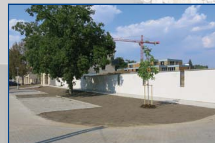
NYNÍ: ulice Za Parkem