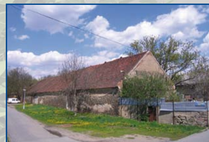
DŘÍVE: ulice Za Parkem