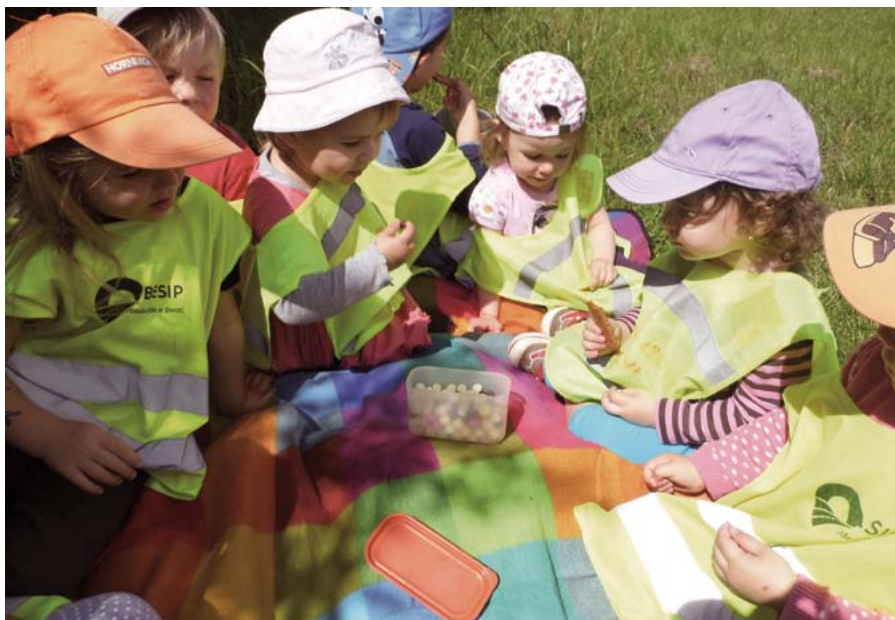
Den v Hobíku - piknik

dost příležitostí k různým zážitkům. Cílem je všensorský letohrádek, okolní lesík a výprava bude zakončena na dětském hřišti. Cestou děti pozorují přírodu, co chtějí, to se nafotí, aby se na to mohly znovu podívat. V jednu chvíli se jim podařilo zahlédnout ledňáčka. Také se nám podařilo jej vyfotit. Během „pikniku na dece“, se hrály drobné hry jako např. na balóčky, rybičky, na vítr, malovalo se na cestu atd. A jako vítr nebo voda tak dětem plynou všechny dny ve školce Hobík.