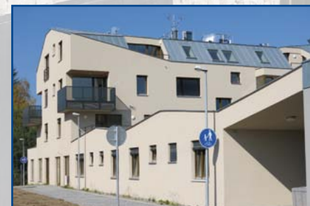
NYNÍ: západní dům G a cyklostezka