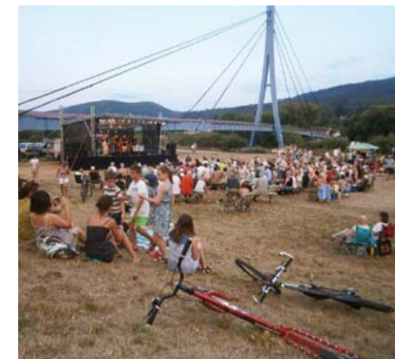
Emingerovou – Praha, Buffoon´s Steam Engines – Praha.