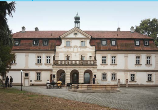
Všenorský zámek z pohledu, který není každý den.