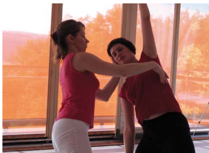
Dechový prostor v pohybu.

Kdy jste naposledy zažili situaci, kdy se ve vás probudila energie, chuť do života, radost nebo cokoliv podobného – pocit souladu sám/sama se sebou? Jak na to reagovalo Vaše tělo? Odkud se podnět vzal? Z vnějšího prostředí nebo z Vás samotných? Jak dlouho s Vámi nabytá energie setrvala? Můžete se k ní vrátet v myšlence, v tělesném prožitku, jednoduchým pohybem, při poslechu hudby? Jak si ji pro sebe vlastními slovy můžete pojmenovat? Jak může být společníkem Vašeho každodenního života?