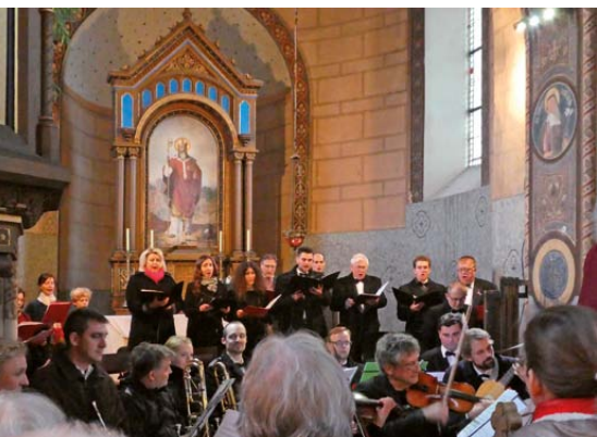
Svatý Václave ...

11. 11. 1918. Ano, tohle je datum, kdy začalo v 11 hodin platit příměří značící konec tak zvané Velké války. Ještě krátce před tím, než vstoupilo v platnost, a také i krátce poté zemřelo nesmyslně na frontách spousta těch, kterým osud věru nepřál. Zbytečně, naprosto zbytečně.