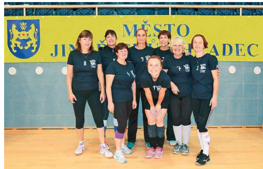
Superseniorky Sokola Dobřichovice na mistrovství republiky v Jindřichově Hradci

V polovině listopadu je na tabulky prvoligových soutěží docela hezký pohled – mužské Áčko je třetí a to ženské je dokonce první, když dosud neprohrálo ani jeden zápas! Doufejme, že to oběma našim družstvům vydrží.