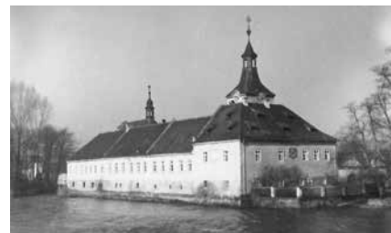
Povodeň v březnu r. 1940

První válečný školní rok je doslova nabitý překotnými událostmi rozličného rázu, které od samého počátku znemožnily úspěšnou výuku, zcela narušily chod školy, okleštily úroveň vzdělávání i dosavadního výchovného zaměření měšťanky.