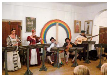
Ludus musicus v baroknı podobe.