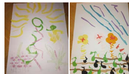
Artefakt 1 a 2.

Tvoření probíhalo v rámci skupiny o 6 členech, která se setkávala pravidelně po dobu jednoho roku. Zde uvádíme dvě z poměrně většího množství technik: „jakou mám barvu, jak jsem se vybarvila“ od autora Miroslava Huptycha, která je základem pro další techniku „můj autoportrét.“ Zjednodušenou podstatou je, jak se barevně jevíme ostatním lidem a co jim chceme říci/ukázat o sobě. Uvádíme tyto techniky zejména proto, že pro jedince může být zdrojem evidence změny, jelikož jsme ji dělali dvakrát – na začátku (viz obrázek Artefakt 1) a na konci (viz obrázek Artefakt 2) ročního setkání.