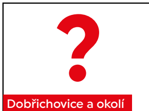
Dobřichovice a okolí

Kompletně vybavená novostavba rodinného domu 5+kk, 152 m 2 . Nízkoenergetický - „A“. Pozemek 868 m 2 . Cena: 13.500.000,-