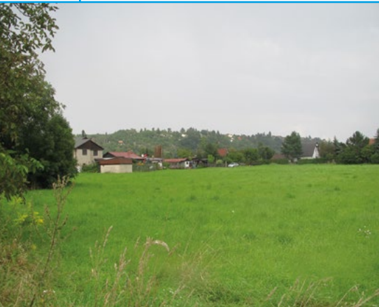
Osada Větrné údolí dnes.