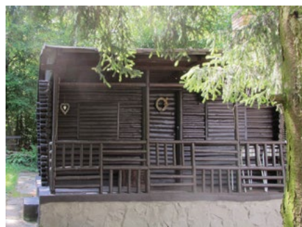
Jeden z původních srubů.

První chaty zde vznikly v 50. letech. Původně zde byl sad, později byl rozparcelován. Nebyla pitná voda, elektrina. Pro vodu se chodilo do studánky nad hotel Zdenka. Později k panu Petržílkovi. Studna se pak budovala společná pro více chat. Nyní je zde natažen letní vodovod. Osadní výbor existuje, ale společenský život zde není, spíše mezi lidmi v jednotlivých částech osady. Hodně se zde staví, chaty se přestavují na domy. Přibývají rodiny s dětmi.