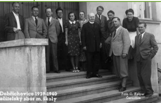
Dobřichovice 1939-1940 učitelský sbor m. školy