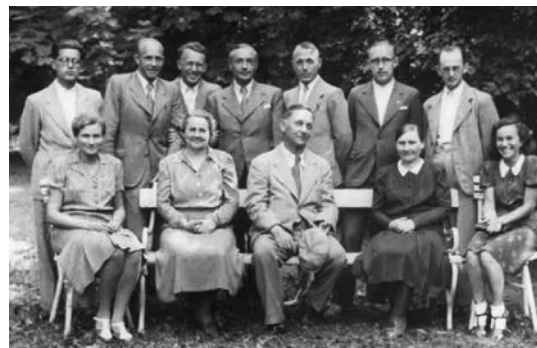
Učitelův sbor na konci školního roku 1940/1941

Stalo se samozřejmostí zdobit obce k výročí vzniku protektorátu a k uctění památky padlých hrdinů a slavit narozeniny Vůdce. K. 12. 4. byla zastavena činnost Sokola. Od 9. května do 16. června obsadil sokolovnu, hostince i některé soukromé byty německý vojenský