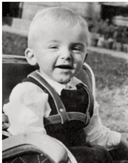
Doma v Mokropsech cca 1955

„dovzdělání“. Železniční trať Praha-Beroun tehdy působila coby nekonečný a nevysychající zdroj budoucích studentů. Všichni