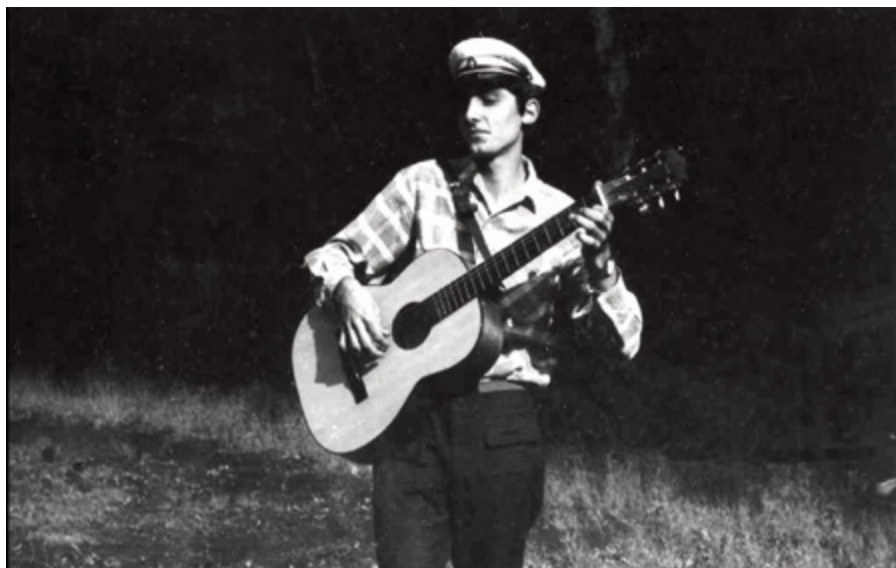
S kytarou před vilou ve Všenorech

„dovzdělání“. Železniční trať Praha-Beroun tehdy působila coby nekonečný a nevysychající zdroj budoucích studentů. Všichni