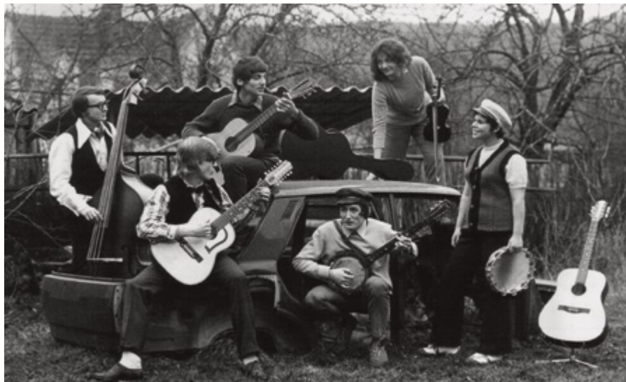
Hudební skupina Repent v roce 1971