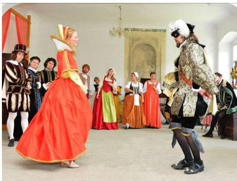
Momentka z Gastoldiho Balettů