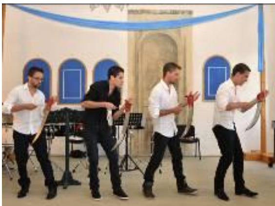
Soubor NeoPercussio ve skladbě pro 4 kovy.