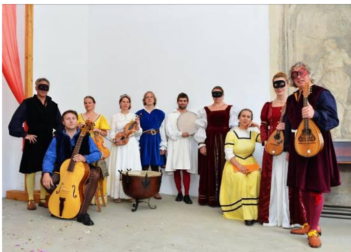
A na závěr Ludus musicus a Škola starého tance krátce po Gastoldiho Balettech.