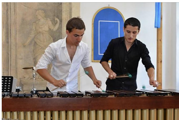
A v ve skladbě pro 4 ruce a marimbu ...