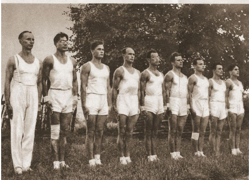
Družstvo gymnastů na OH v Londýně r. 1948