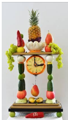
Arcimboldovské horologium z dílny pánů Martina Vaculíka a Jana Havrlanta.