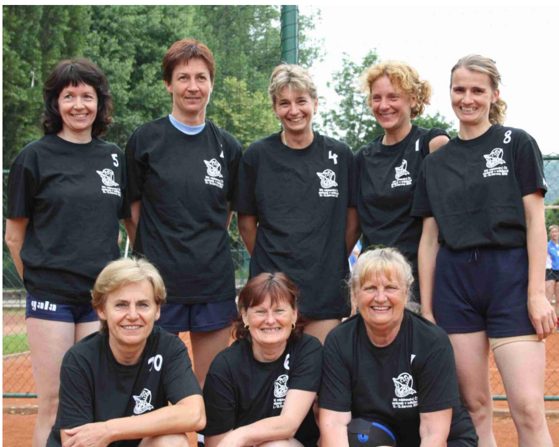
Družstvo dobřichovických senierek.

Dobřichovické Kukátko • XXVI/2010/3–Podzim Přesahy aneb co se do tištěné verze nevešlo