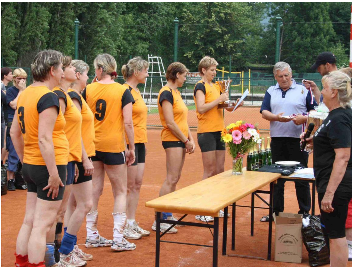
Vítězné družstvo ABC Braník přebírá trofej.