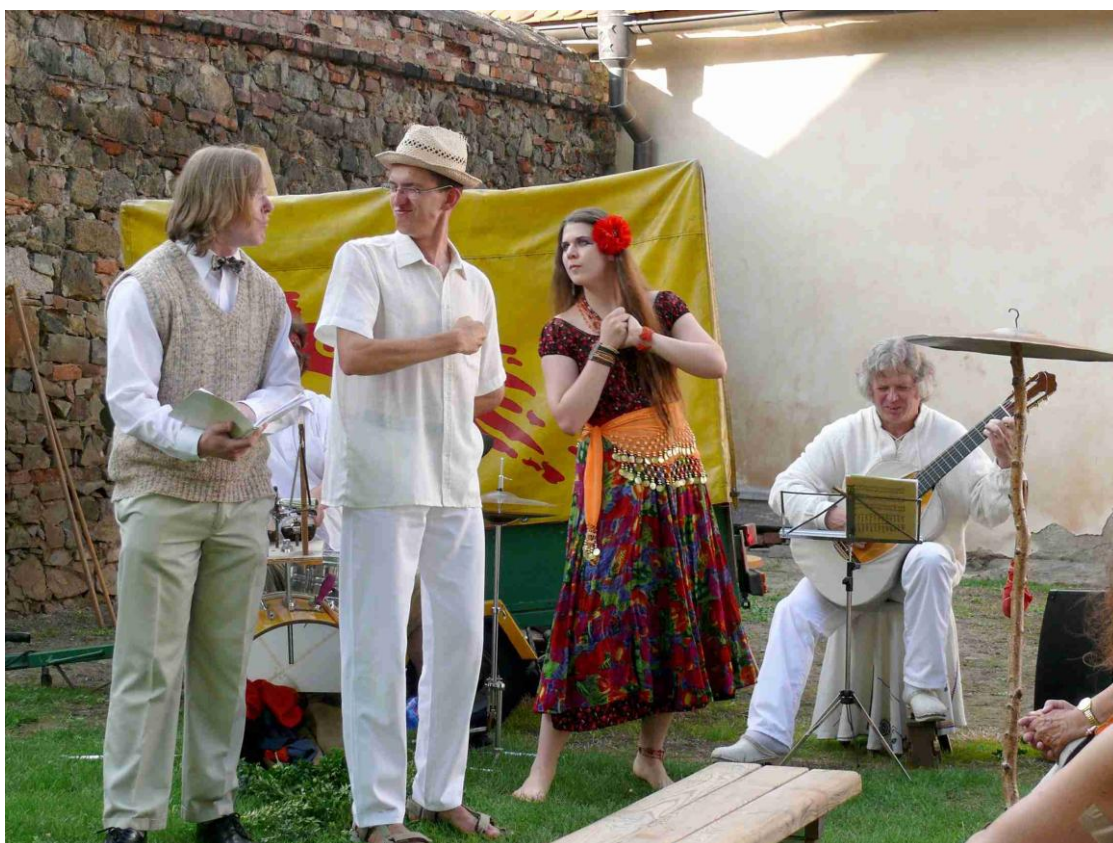
Ludus musicus ve své trampsko - swingové podobě.