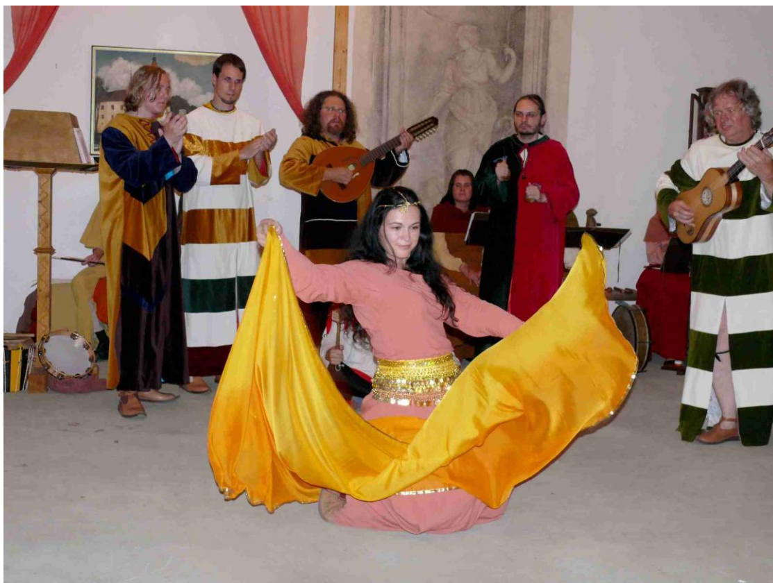
„Španělská“ momentka z programu Z Čech až na konec světa.