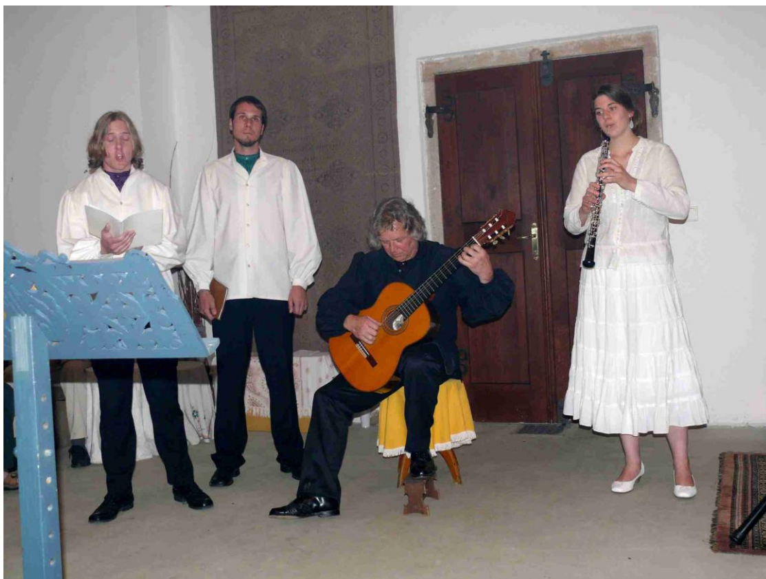
Ludus musicus a zhudebněná poesie V. Dyka.

Dobřichovické Kukátko • XXVI/2010/3–Podzim Přesahy aneb co se do tištěné verze nevešlo