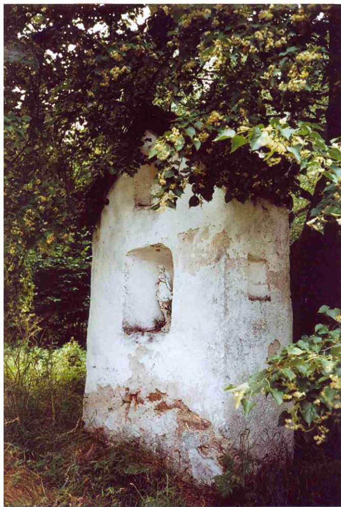
Kaplička v Kaprounu.